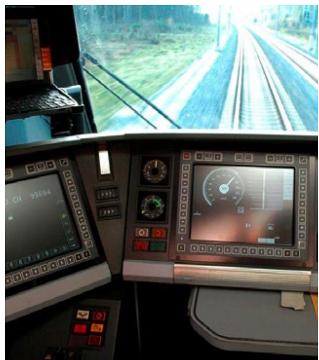
ETCS L2 liefert dem Lokomotivführer Anweisungen auf einen Bildschirm.