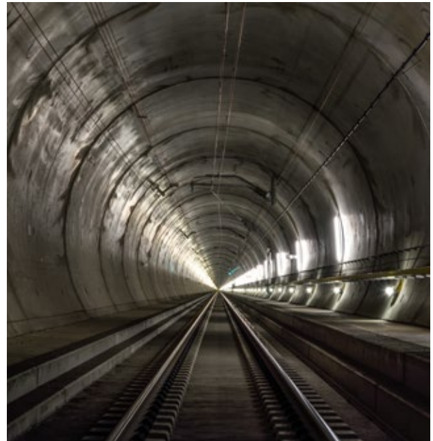
Im Gotthard-Basistunnel sind Transporte mit 4 Metern Eckhöhe möglich.

Während auf der Lötschberg-Achse sowie im Gotthard- und Ceneri-Basistunnel der Bahnverlad von Sattelaufliegern mit 4 Metern Eckhöhe bereits möglich ist, musste auf den Zulaufstrecken am Gotthard diverse Hindernisse beseitigt werden. Mit dem Projekt 4-Meter-Korridor wurden wo nötig Tunnels, Perrondächern und Fahrleitungen angepasst. Damit ist nach Abschlussarbeiten der durchgehende Transport von Behältern mit 4 Metern Eckhöhe auf den schweizerischen Nord-Süd-Achsen möglich. Dies ist wichtig, weil Transporte mit 4 Metern Eckhöhe im kombinierten Verkehr ein stark wachsendes Segment darstellen. Die Schweiz finanziert auch entsprechende Profilanpassungen auf der italienischen Luino-Linie, damit wichtige Umlade-