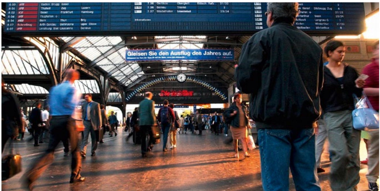
Dank ZEB erhalten die Bahnpassagiere ein noch besseres Angebot.

1987 wurde das Projekt BAHN 2000 zur Steigerung der Qualität des Schweizer Schienennetzes beschlossen. Es beinhaltet Massnahmen zur Beschleunigung und Verdichtung bestehender Verbindungen sowie zur Modernisierung des Rollmaterials. In der 1. Etappe von BAHN 2000 wurden bis