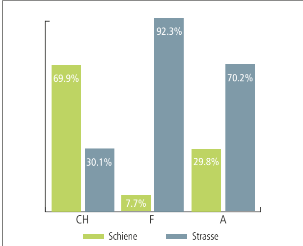
Verteilung des alpenquerenden Güterverkehrs in Frankreich, Österreich und der Schweiz (2017).

Im alpenquerenden Güterverkehr hält die Bahn in der Schweiz einen Marktanteil von 70 Prozent, die Strasse liegt bei 30 Prozent (Jahr 2018). In den Nachbarländern Frankreich und Österreich ist das Verhältnis umgekehrt.