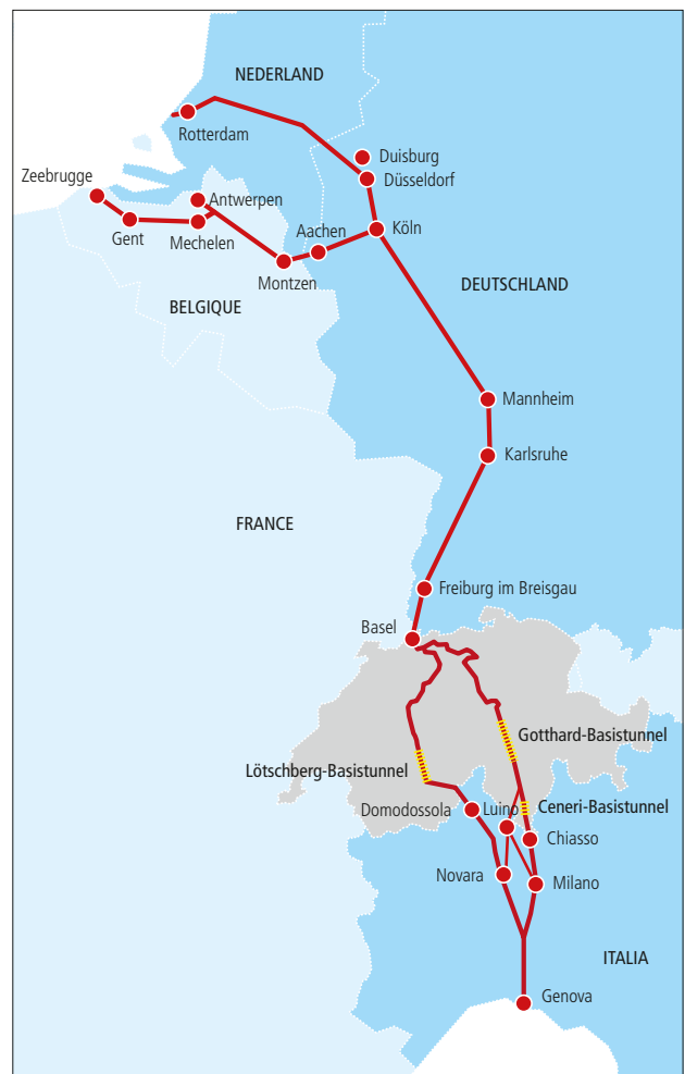
Die EU misst dem Korridor Rotterdam–Genua grosse Bedeutung bei.

Die Schweiz soll besser an das europäische Netz für den Hochgeschwindigkeitsverkehr (HGV) angeschlossen werden. Dafür hat das Parlament 2005 ein Paket von Massnahmen verabschiedet. Es beinhaltet die Mitfinanzierung von Projekten in Frankreich und Deutschland sowie Ausbau-