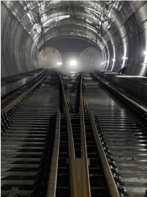
Der Lötschberg-Basistunnel verkürzt die Fahrzeiten zwischen der Schweiz und Italien.

In der Schweiz waren im Jahr 2000 rund 260 000 Menschen übermässigem Lärm der Eisenbahn ausgesetzt. Zu ihrem Schutz wurde ein umfassendes Konzept zur Lärmreduktion umgesetzt und durch den FinöV-Fonds finanziert. Realisiert wurden Massnahmen am Rollmaterial, der